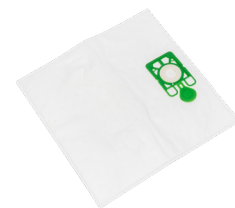
MIKROFASER- STAUBSAUGER- BEUTELN