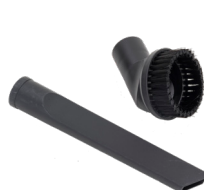
FUGENDÜSE UND STAUBBÜRSTE