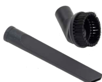
SUCEUR PLAT ET BROSSE À ÉPOUSSETER