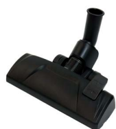
OUTIL DE SOL