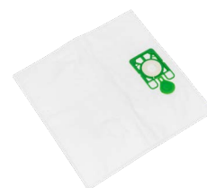
SACS POUSSIÈRE EN MICROFIBRE