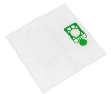
SACS À POUSSIÈRE EN MICROFIBRE