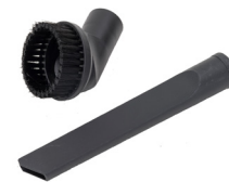
SUCEUR PLAT ET BROSSE À ÉPOUSSETER