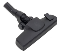
OUTIL DE SOL