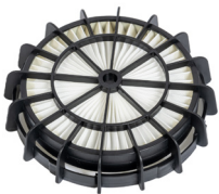
FILTRE HEPA 13