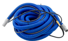
15 M NIEDER-DRUCKSCHLAUCH