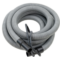
6 M NIEDER-DRUCKSCHLAUCH