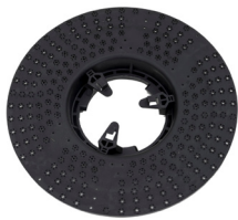
ECO LOK TREIBTELLER