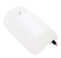
FRISCHWASSER-TANK (12 LITER)